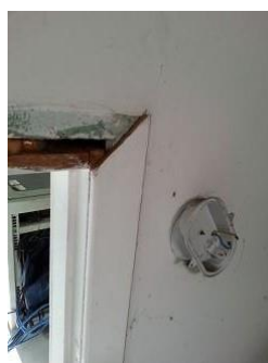
Marco e interruptor quebrados