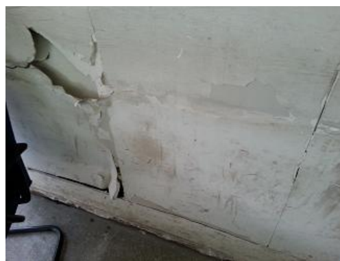
Paredes com reboco caindo e sujas

O Suport-ES não compactua com a atitude da empresa e está ao lado dos trabalhadores para denunciar as más condições de trabalho e exigir providências.