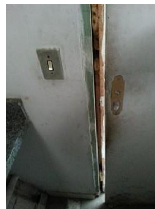
Porta sem maçaneta