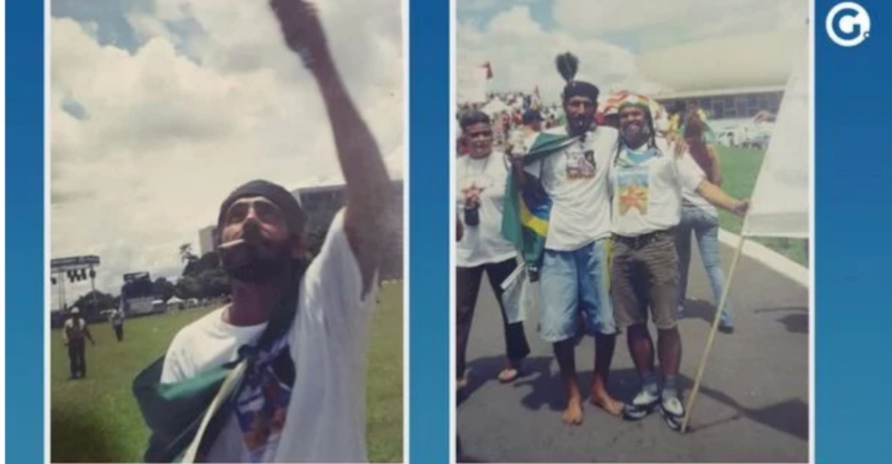
Aposentado capixaba esteve na posse de Lula em 2003.