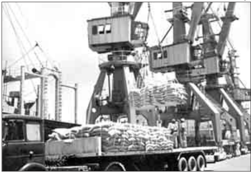
Movimentação de carga em porto: denúncia do Ministério Público